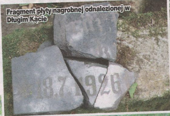
Fragment płyty nagrobnej odnalezionej w Długim Kącie