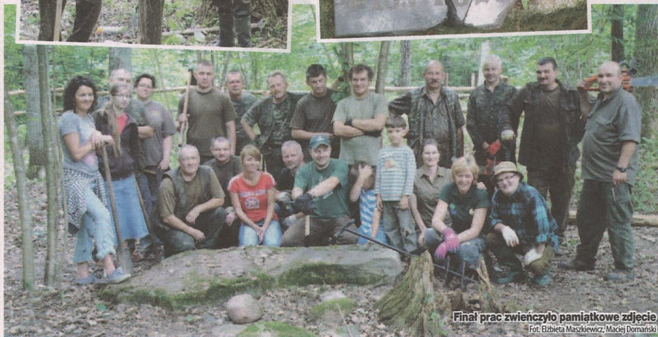
Final prac zwińczyło pamiątkowe zdjęcie