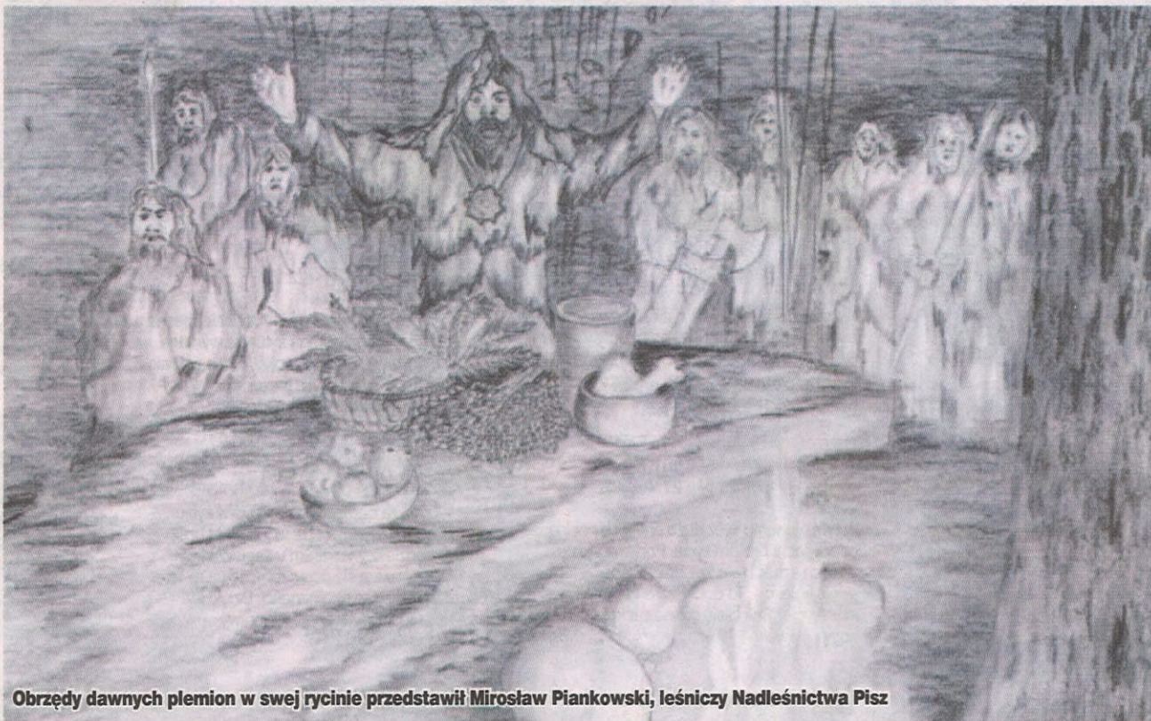
Obrzędy dawnych plemion w swej rycinie przedstawił Mirosław Piankowski, leśniczy Nadleśnictwa Pisz